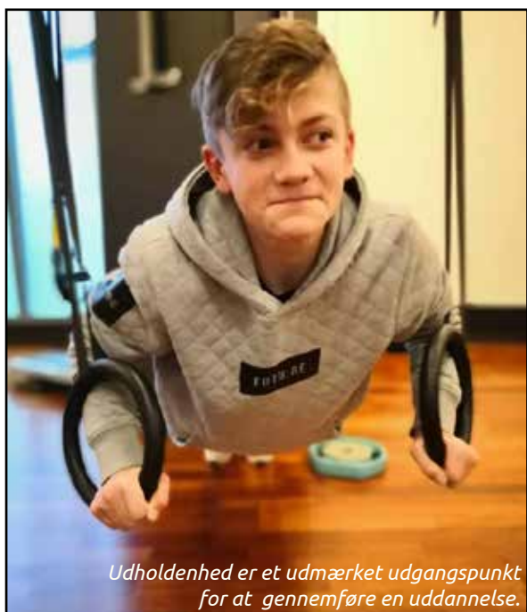
Udholdenhed er et udmærket udgangspunkt for at gennemføre en uddannelse.