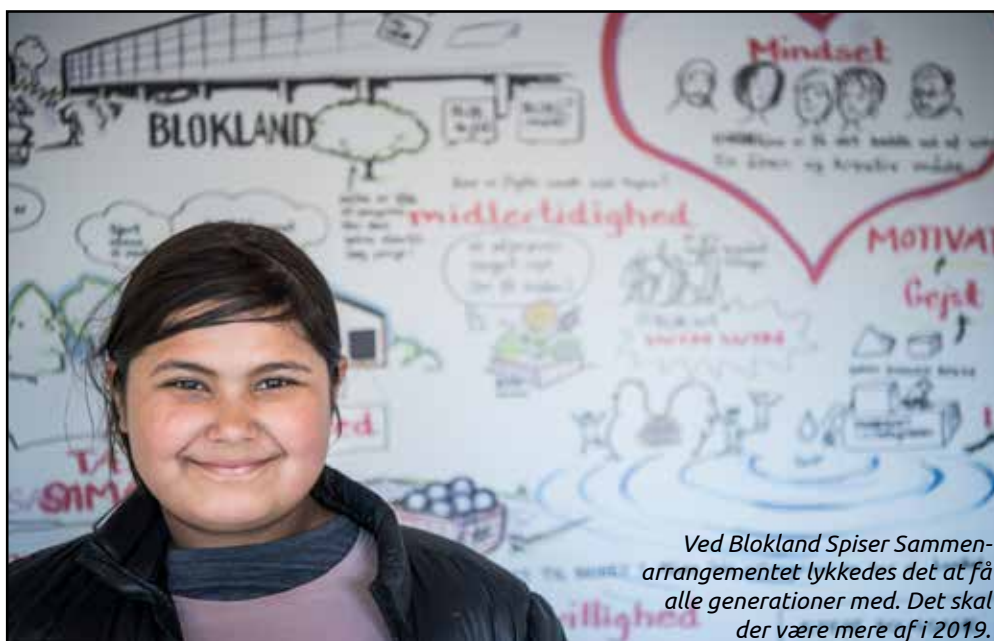
Ved Blokland Spiser Sammen-arrangementet lykkedes det at få alle generationer med. Det skal der være mere af i 2019.

Hvad ønsker Blokland så for 2019? Endnu flere aktiviteter! Men især at gøre en ekstra indsats for at involvere flere unge i de fælles aktiviteter.