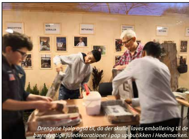
Drengene hjalp også til, da der skulle laves emballering til de bæredygtige juledekorationer i pop up-butikken i Hedemarken.