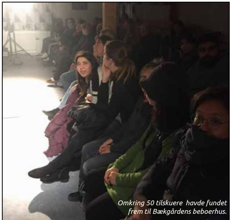
Omkring 50 tilskuere havde fundet frem til Bækgårdens beboerhus.