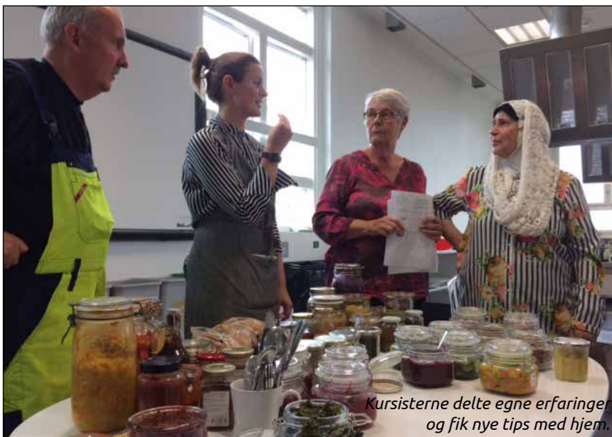
Kursisterne delte egne erfaringer og fik nye tips med hjem.

Kurset var en naturlig opfølgning på den studietur, som ABC tidligere har arrangeret om byhaver og grønne fællesskaber.