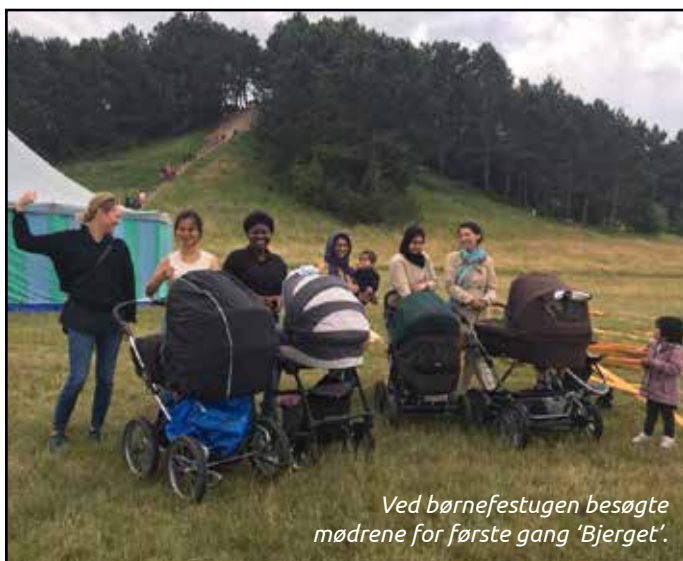
Ved børnefestugen besøgte mødrene for første gang 'Bjerget'.

I løbet af de sidste tre måneder har vi været på besøg hos Tandplejen på Herstedlund Skole, til Børnefestuge og på Picnic på Dyregården. Nu holder vi sommerferie. Gruppen starter igen den 31. juli.