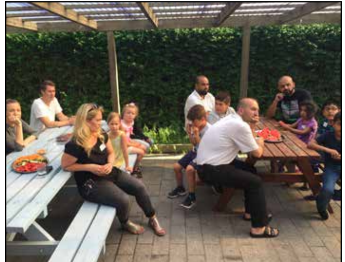
Børn og forældre i 0. E mødes i trivselsgrupper for at skabe Danmarks bedste skoleklasse. En af ABC's opgaver frem til 2020 er at styrke netværk mellem forældre, og arbejde for at flere børn får et godt skoleliv.

Første trivselsaften handlede om forventningsafstemning mellem skole og forældre. Hvad har en 0. klasses-elev af behov? Og hvor og hvordan