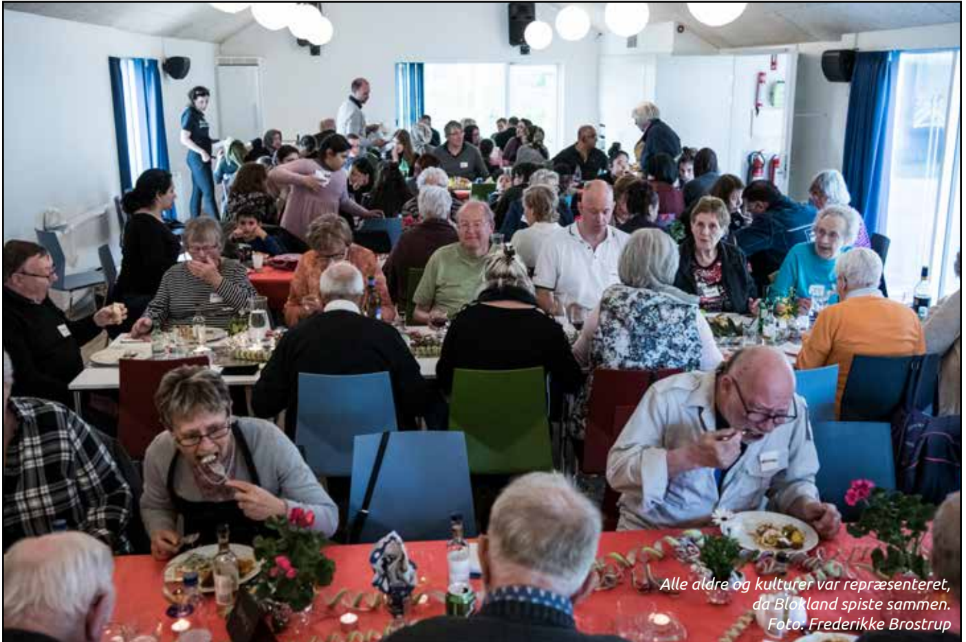
Alle ældre og kulturer var repræsenteret, da Blokland spiste sammen.

Uge 17 er af Folkebevægelsen mod Ensomhed udråbt til Danmark Spiser Sammen-uge. Blokland havde i år koblet sig på kampagnen for at skabe mere fællesskab i bebyggelsen.