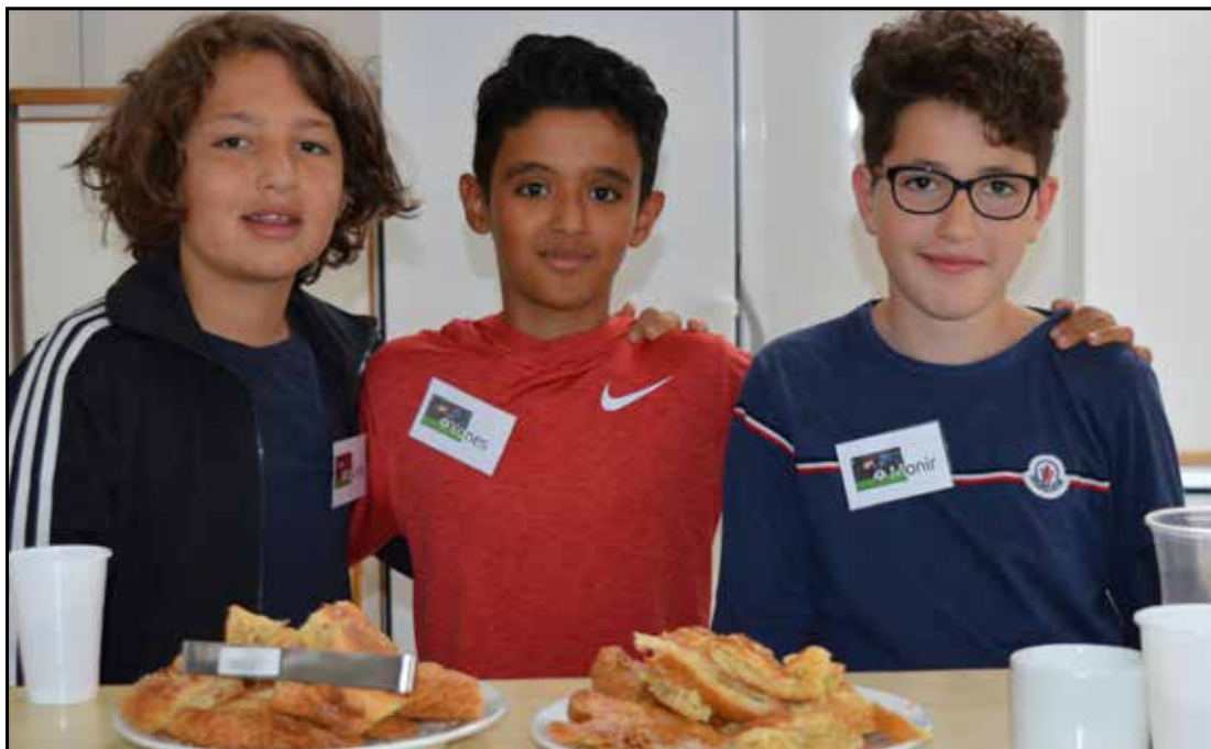
Tre af drengene i lommepegeprojektet stod for baren, da der var VM på storskærm i Albertslund Nord.

Dette års lommepegeprojekt har været længe undervejs, da der var behov for at udvikle konceptet og revidere indholdet. Både hvad angår målgruppe, formål, samarbejdspartnerne og i forhold eksisterende tiltag.