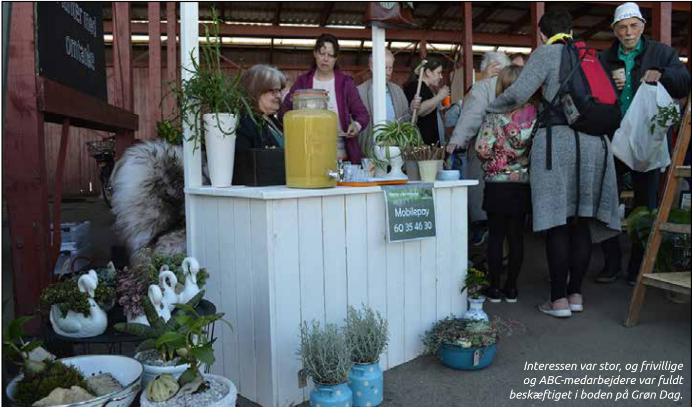
Interessen var stor, og frivillige og ABC-medarbejdere var fuldt beskæftiget i boden på Grøn Dag.

Den kommende socialøkonomiske virksomhed i Hedemarken satser på bæredygtige plantedekorationer i genbrug. Et alternativ til en forurenende blomsterindustri. Men er der et marked? Det blev testet, da vi mødte de potentielle kunder på Grøn Dag.