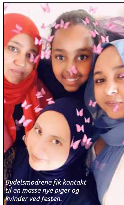
Bydelsmødrene fik kontakt til en masse nye piger og kvinder ved festen.

Følg Bydelsmødre Albertslund på facebook.