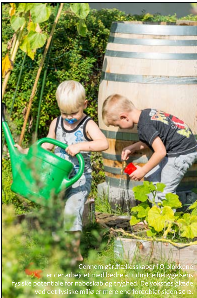
Gennem gårdfællesskaber i O-blokkene er der arbejdet med bedre at udnytte bebyggelsens fysiske potentiale for naboskab og tryghed. De voksnes glæde ved det fysiske miljø er mere end fordoblet siden 2012.

Styregruppen er nået rigtig godt i mål med de sidste fire år. Der har helt fra 2013 været arbejdet med fokus på forankring, og det er i høj grad lykkedes. Heldigvis er der dog også plads til og brug for udvikling. Der skal i fremtiden arbejdes på at få endnu flere nye frivillige i området. Der skal arbejdes på at få flere aktiviteter, som er målrettet børnefamilier og flere forskellige kulturer. Det passer rigtig godt med indsatserne i den nye helhedsplan, som alle parter glæder sig til at komme i gang med.