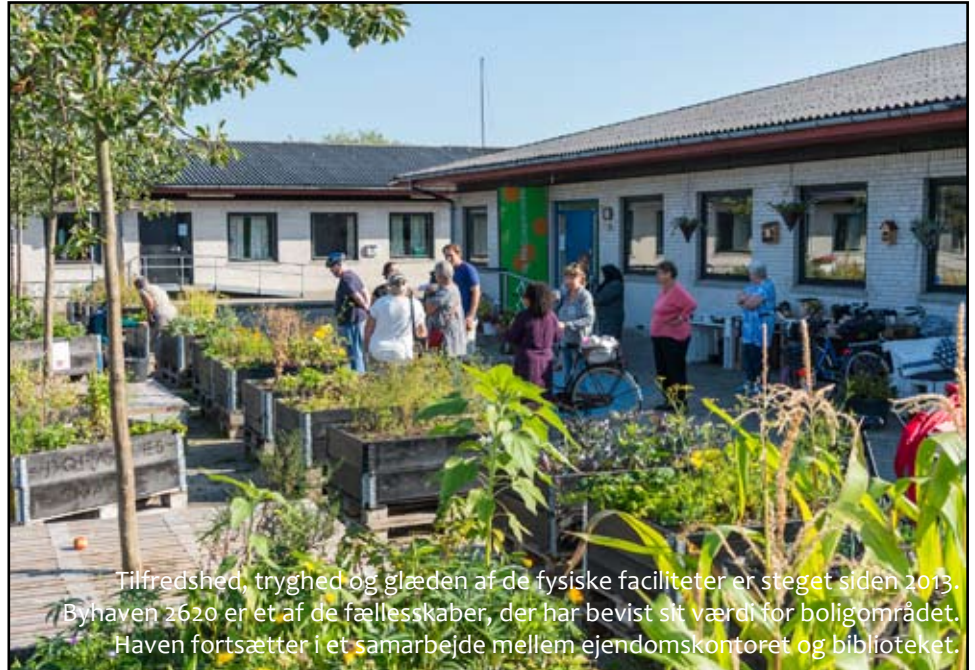
Tilfredshed, trykthed og glæden af de fysiske faciliteter er steget siden 2013. Byhaven 2620 er et af de fællesskaber, der har bevist sit værdi for boligområdet. Haven fortsætter i et samarbejde mellem ejendomskontoret og biblioteket.

Fællesspisningen mødes hver 14. dag og spiser og hygger sammen. Frivillige laver mad, dækker bord og byder velkommen til nye gæster. Det har de gjort i tre år, og det er blevet en uundværlig del af deres liv. Fællesspisningen er nu forankret i afdelingen, der lægger lokaler og køkken til.