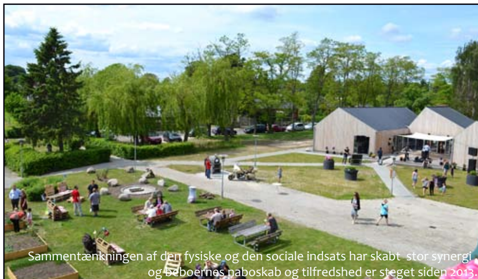
Sammentænkningen af den fysiske og den sociale indsats har skabt stor synergi og beboernes naboskab og tilfredshed er steget siden 2013.