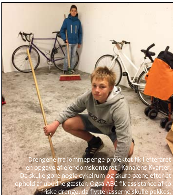
Drengene fra lommepenge-projektet fik i efteråret en opgave af ejendomskontoret i Kanalens Kvarter. De skulle gøre nogle cykelrum og skure pæne efter et ophold af ubudne gæster. Også ABC fik assistance af to friske drenge, da flyttekasserne skulle pakkes.

For både børn og unge er det tydeligt, at fysisk fornyelse i boligområderne har stor betydning for trykthed og tilfredshed. Albertslund Nord, som både er blevet renoveret og områdefornyset, har oplevet en voldsom stigning i børn og unges trivsel dér, hvor de bor. Og Byhaven 2620 kan have haft betydning for, at der er stor fremgang i de 12-15 åriges glæde af det fysiske miljø i Hedemarken, hvor der ellers endnu ikke er blevet renoveret.