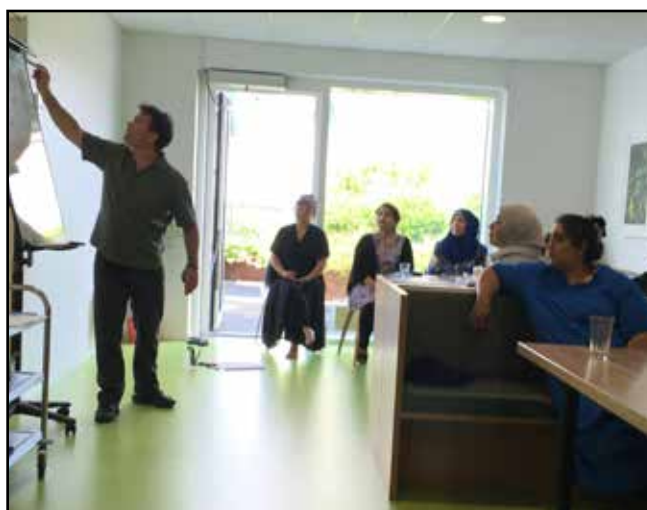
Der var stor koncentration ved det indledende oplæg