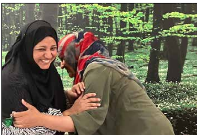
Der var også tid til knus og latter på dagen.