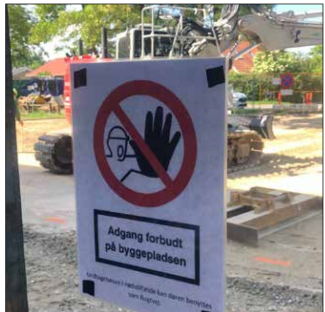
Kranerne var til sidst det daglige udsyn for ABC's medarbejdere i sekretariatet i Blokland.