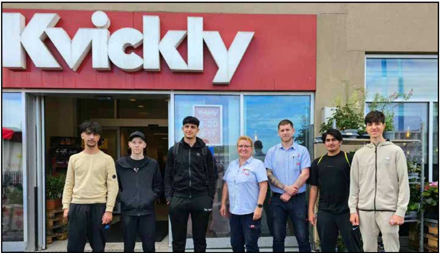
De fem nye fritidsjobbere foran Kvickly i Albertslund.

ABC's samarbejdemed Kvickly og Albertslund Uddannelse & Job hjælper unge i gang med fritidsjob.