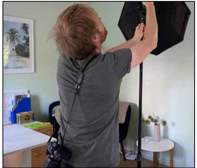
Fotografen Thomas gør klar til at tage portrætbilleder til ansøgernes CV & LinkedIn.

Efter en grundig introduktion til LinkedIn, vidensdeling om netværk som en vigtig del af rejsen hen imod job samt tips & tricks ændrede rummet sig til et socialt IT-værksted. Tiden fløj afsted, og alle deltagere gik stolte hjem med en ny og/eller opkvalificeret LinkedIn-profil.