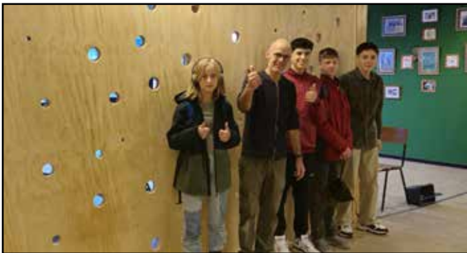
Her ses fire elever foran skillevæggen "Osten" på Egelundskolen.