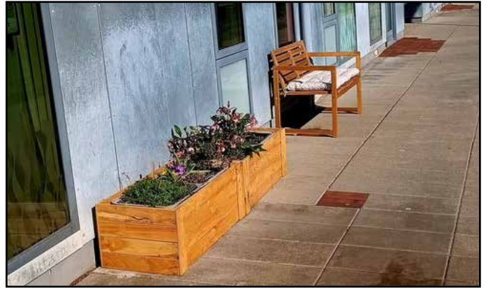
Siden workshoppen er der blevet sat en bænk og to plantekasser ud foran ABC's kontor i Kanalens Kvarter 100.

Til workshoppen deltog beboere, afdelingsbestyrelsesmedlemmer, kommune og BO-VEST. Der blev drøftet mange muligheder og idéer til, hvordan der kan skabes mere liv i Kanalgaden. Næste skridt er et opfølgende møde i maj og derefter at få nedsat en projektgruppe med repræsentanter fra de forskellige parter, som kan arbejde videre med de tiltag, der aftales.