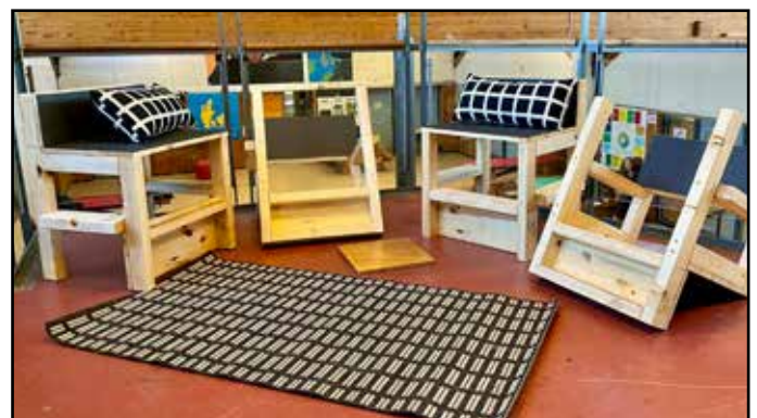
Herstedvester Skoles signaturstol "Sid ordentligt" tilbyder fodstøtte og kan vendes om og blive til en lænestol